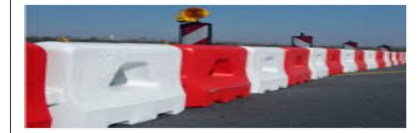
Mise en place de Bali road